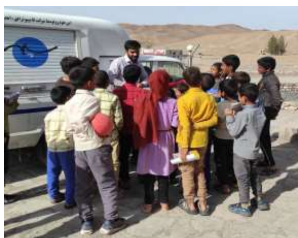
تصاویر شماره ۲: سفرهای کتابخانه سیار افق به روستاها