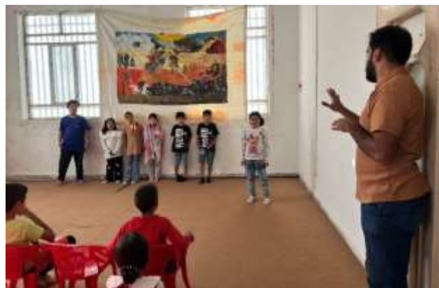
تصاویر شماره ۳: اجرای فعالیت‌های آموزشی در مرکز فروزان نژاد