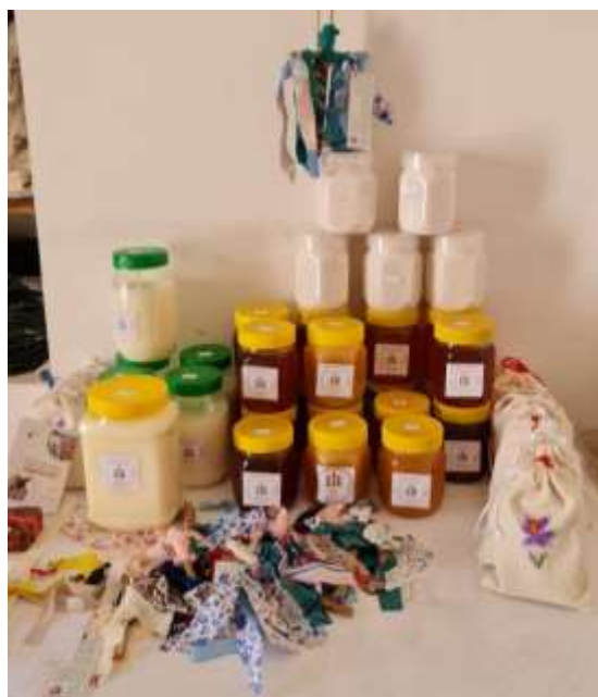
تصویر شماره ۷: نمونه محصولات کسب و کار چولی قزک

از ابتدای راه‌اندازی سیارک، تیمی پرتلاش، عزم خود را جزم کرده تا این کتابخانه سیار را به قلب روستاها برساند. این هم‌افزایی و تلاش جمعی، عامل اصلی موفقیت و پیشبرد اهداف این پروژه بوده است؛ امری که دستیابی به آن به صورت فردی، قطعاً میسر نمی‌شد. اعضای این تیم، با همراهی مسئول سیارک سپهر، کسب‌وکاری اجتماعی را بنیان نهاده‌اند. هدف اصلی این کسب‌وکار، اختصاص سود خالص به فعالیت‌های اجتماعی سیارک و در عین حال، فراهم آوردن بستری امن و باثبات برای اعضا است تا بتوانند با فراغ بال و دغدغهی کمتر، به فعالیت‌های داوطلبانه و دلی خود بپردازند. چولی قزک در سال ۱۴۰۴، با اهدای مبلغ ۱۰۰.۰۰۰.۰۰۰ ریال به سیارک سپهر و حضور اعضای خود به عنوان داوطلب در کنار ما، نشان از همراهی و حمایت ارزشمند خود داشت.