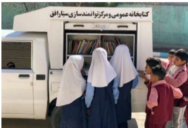
تصویر شماره ۱: کتابخانه سیار افق در روستای فیروزآباد