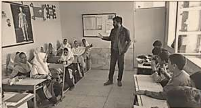
شکل گرفت و امروز با عنوان سیارک سپهر شناخته می‌شود. آقای کارگر، کتابدار سیارک سپهر چه فعالیت‌های انجام می‌دهد؟