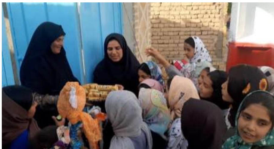
تصاویر شماره ۴: اجرای آیین چولی‌قزک در روستای زول